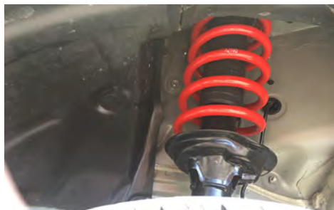
フロント装着写真。