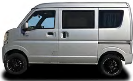
リゾートデュオ バスキング EVERY(DA17V)ベース

走行性能をアップし、乗り心地が大きく変化します。コーナリングや高速走行で威力を発揮。雪道や林道をストレスなく走行できます。リヤもフロントと同様、3.5センチアップです。Stage21の軽キャンピングカーバスキングにも、もちろん装着可能です。