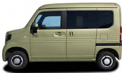
リゾートデュオ バスキング N-VANベース