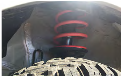
フロント装着写真。デモカーは14インチ のホイール タイヤを装着しています。