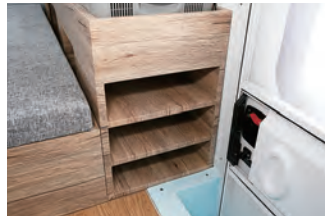
エントランス右側はシューズケースにな っています