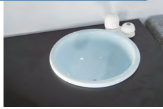
シンクにはシャワーヘッドタイプが付き ます。