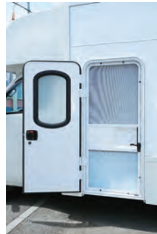
エントランスドアの内側には網戸が 付いています。