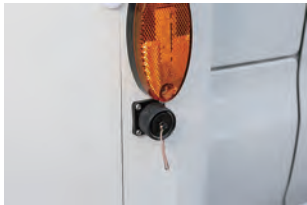
AC100Vはここから車内に引き込み ます。