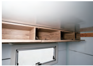
リヤ上部に3連の扉付き収納があり ます。