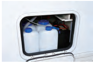
給排水タンクは10L。外から出し入れ できます。