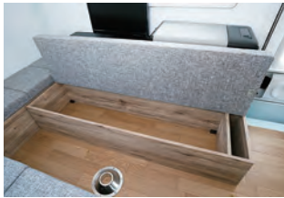
長物は反対側のシート下に収納でき ます。