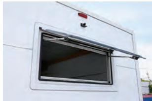
リヤに2重アクリルの窓が装備され ています。