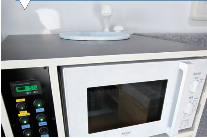
コンパクトにまとめられたギャレー。電子レンジが標準装備