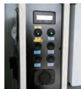
使いやすく一つにまとめたスイッチパネル