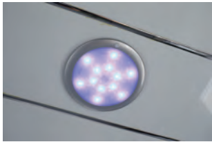
LED照明、ブルーカラーに変換でき ます。