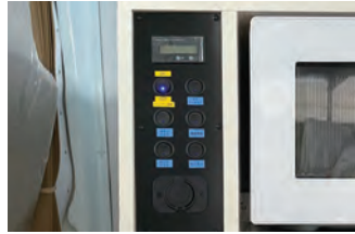
使いやすくて一つにまとめたスイッチパネル