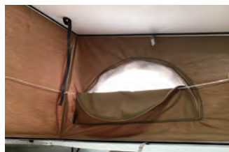
ポップアップテントは、防水防炎生地を使用しています。左右には防虫ネットが施されています。