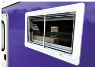
両サイド / 網戸・カーテン付スライド窓