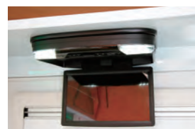
15インチフリップダウンモニター