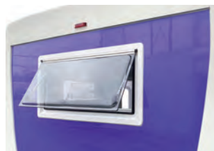
リア / 網戸・カーテン付プッシュアウト窓