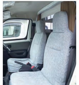
好みの生地でシートカバー