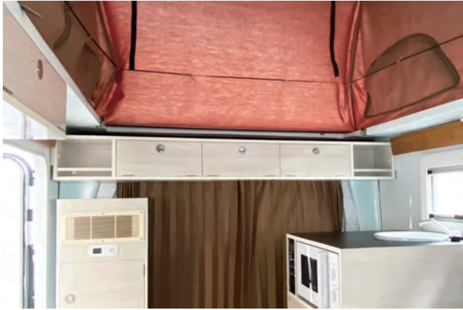
白を基調とした明るい木目柄のギャラリー、扉付きの収納棚で室内をすっきり。