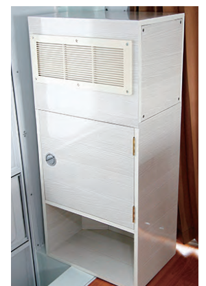
低電力クーリングシステム冷蔵Xが搭載

携帯やスマホの充電を始め、冷蔵庫やテレビなどの家電が24時間365日使い、車中泊を快適にすることができます。電気はソーラー充電をはじめ、走行充電、AC充電の3段階です。