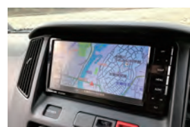
地デジフルセグチューナー付国産カーナビ(バックカメラ付)