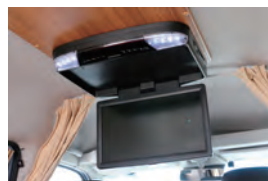
地デジ対応15インチのDVD付フルHDモニター

携帯やスマホの充電を始め、冷蔵庫やテレビなどの家電が24時間365日使い、車中泊を快適にすることができます。電気はソーラー充電をはじめ、メインに走行充電、AC充電の3段階です。