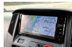
地デジチューナー付国産カーナビ(フルセグへの変更可能)