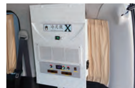
低電力クーリングシステム冷蔵庫Xが搭載