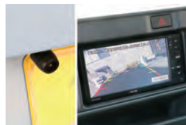
バックカメラで車庫入れラクラク