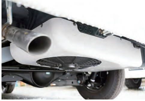
クーラーの室外機は車体の下に格納されていて最低地上高も守られます。