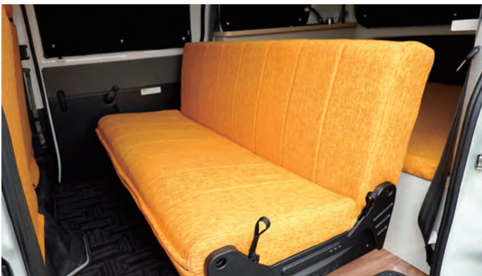
レポシート前向き 運転中はこちらのモードです