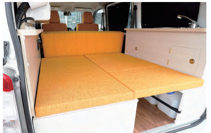
リアゲートが開くので、後ろから荷物の積み込みができます