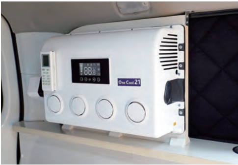
夏場に欠かせない12VクーラーOne Cool 21。