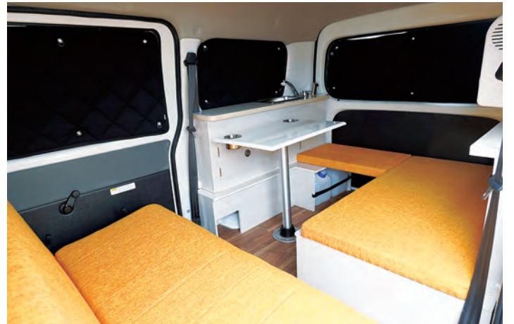
レポシートと対面にセットするとコの字型のダイニングができます