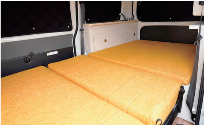
ベッド展開すると大人二人、186x120mmでくつろげます

乗用車に乗り換えたい。でもミニバンのようなデコボコシートではなくフラットなシートで車中泊もできる車が欲しい。そのご要望で製作したのがLUXIO IV(WGN BASE)です。たまに車中泊車として利用する時でも、必要最低限の装備と12Vクーラーが付いていますので快適にお使いいただけます。