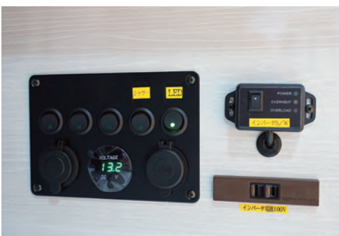
集中電気管理スイッチパネル(デジタル電圧メーター表示) 12Vシガーソケット/USBソケット2口付。