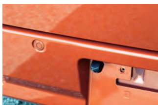
バックカメラが標準で装備

標準はエコフローDELTA RIVERですが、EF DELTA MINI(1500W)などへ変更できます ※オプション