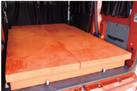
厚さ6.5cmのこだわりベッド

ベッドマット187cm×120cm軽バンキャンパーのサイズでもゆったりくつろげるベッドです。