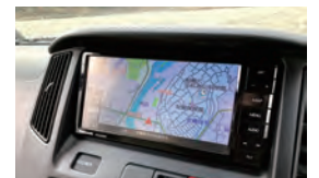
地デジフルセグチューナー付国産カーナビ(バックカメラ付)