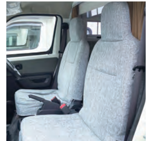
運転席・助手席リクライニングシート