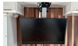
15インチモニター(ナビ連動)