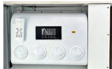
One Cool 21 (12Vエアコン)が標準装備。

走行充電器とMPPTソーラーコントローラーで夜間以外は常時充電。携帯やスマホの充電を始め、冷蔵庫やテレビなどの家電が24時間365日使え、車中泊を快適にすることができます。