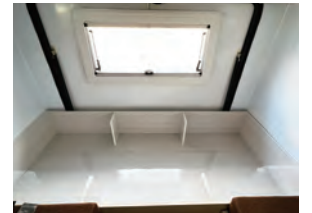
1Fベッドマット：約180cm×174cm、厚さ6.5cm 2Fベッドマット：約147cm×120cm、厚さ2cm